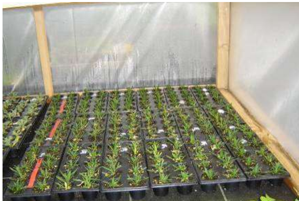
Slika 2: Postavitev poskusa pod folijo (primer)