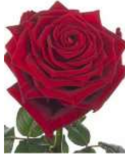
Slika 4: Rosa - vrtnica