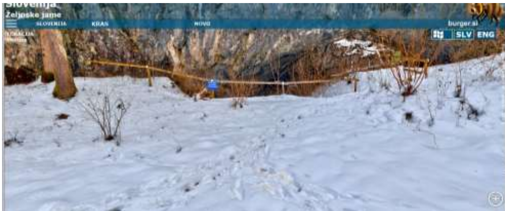
Slika 3: Željnske jame

“Željnske jame so izjemno zanimiv, okrog 1600 m dolg vodoraven jamski sistem Rudniškega potoka z več vhodi. Potok se pretaka pod Kočevskim Rogom proti Podturnu, kjer se pojavi v potoku Radeščica, pritoku Krke.” ( http://www.burger.si/Jame/ZeljnskeJame/ZeljnskeJame.html )