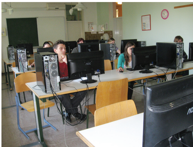
Spletno anketiranje udeležencev o zadovoljstvu z izobraževanjem

Način spremljanja: Z anketami in intervjuji udeležence povprašamo o kakovosti predavanj, gradivih, učbenikih, metodah in oblikah dela, počutju in kulturi sodelovanja med dijaki, učitelji in ostalimi udeleženci izobraževanja.