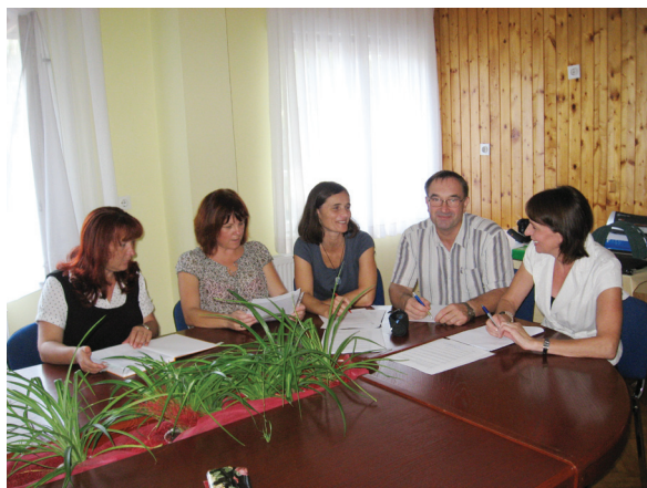
Sestanek komisije za kakovost

Komisija za kakovost vsake tri mesece pregleda ureničevanje akcijskega načrta.