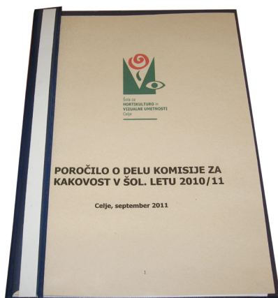
Naslovnica Poročila o delu komisije za kakovost za šolsko leto 2011/12

Vsako leto komisija za kakovost na osnovi predlogov udeležencev izobraževanja izbere vsaj dve področji presojanja kakovosti. Na osnovi analiz anketnih vprašalnikov, pogovorov in zastavljenih aktivnosti pripravi poročilo o doseženi ravni kakovosti na izbranih področjih.