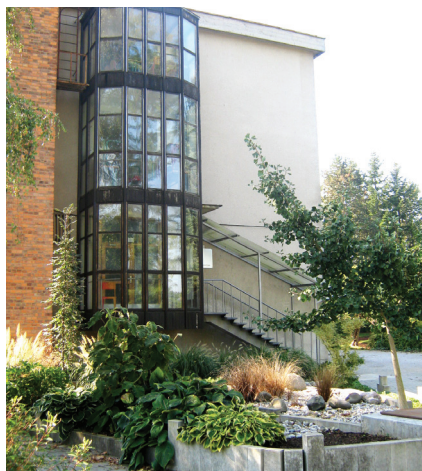
Šola za hortikulturo in vizualne umetnosti Celje

Listina temelji na dosedanjih načinih načrtne skrbi za kakovost, ki smo jih v praksi že preizkusili.