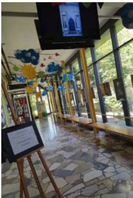
Razstava na šolskem hodniku